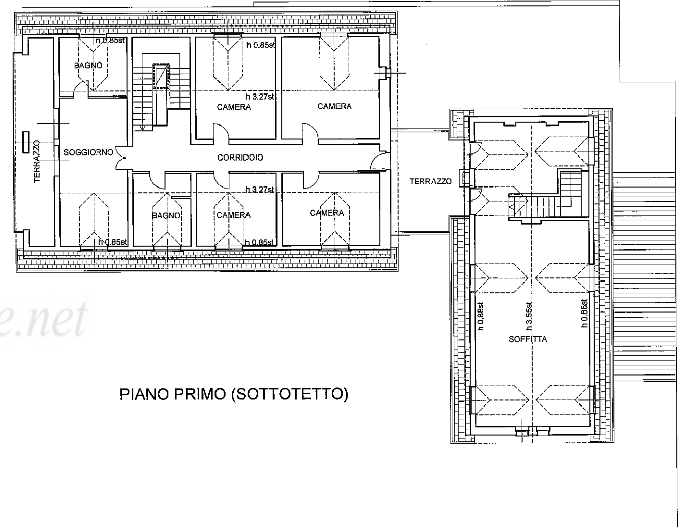
PIANO PRIMO (SOTTOTETTO)