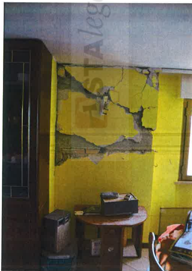
Foto n° 10: vista interna - particolare lesione muratura locale soggiorno.