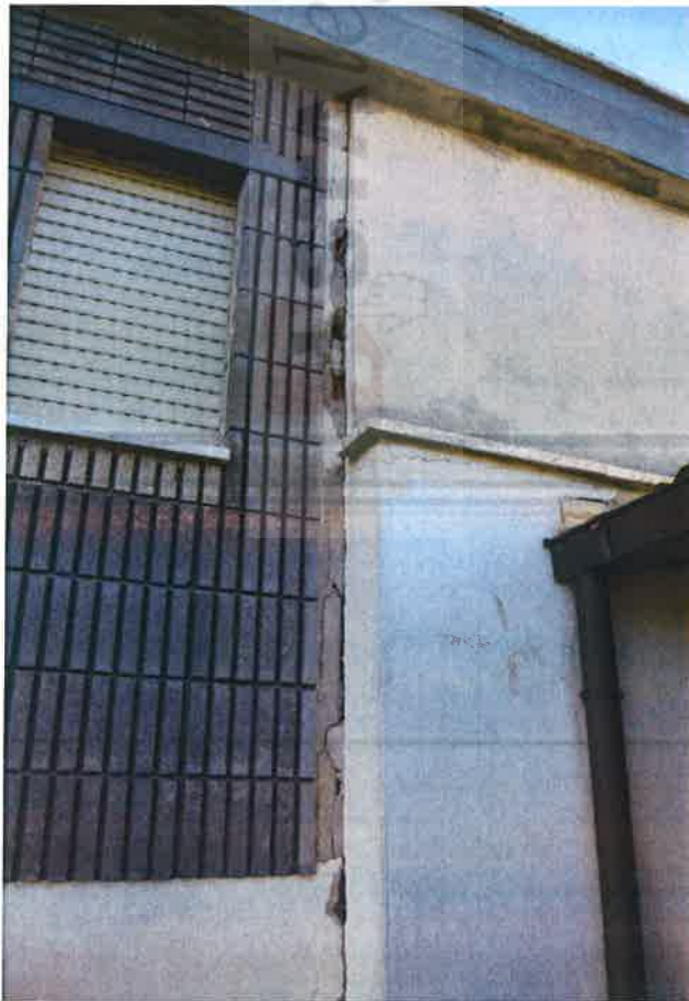
Foto n° 12: vista esterna - particolare lesione giunto tecnico lato est.