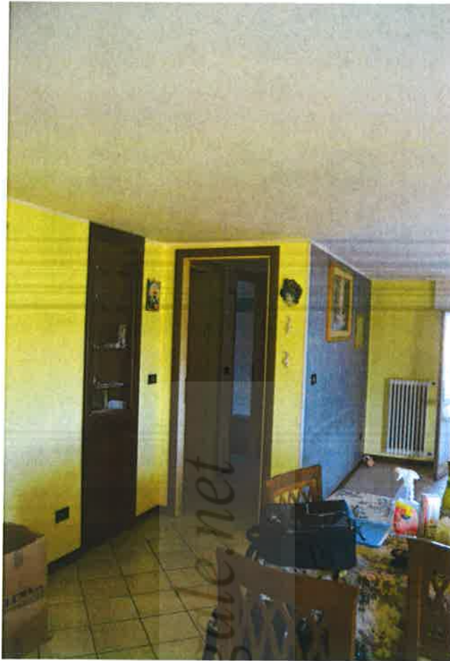
Foto n° 3: vista interna - locale soggiorno e corridoio zona notte.