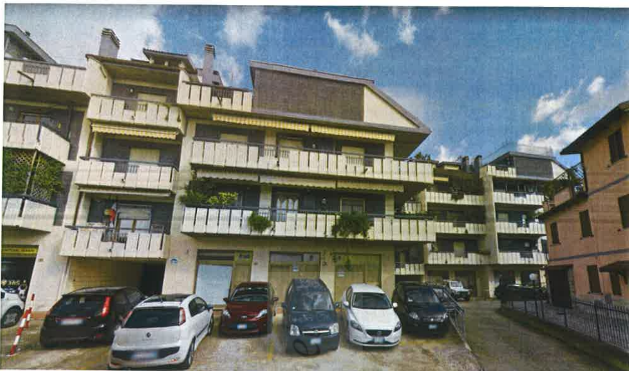
Foto n° 1: vista esterna fabbricato (lato ovest) su Via Emidio Luzi.