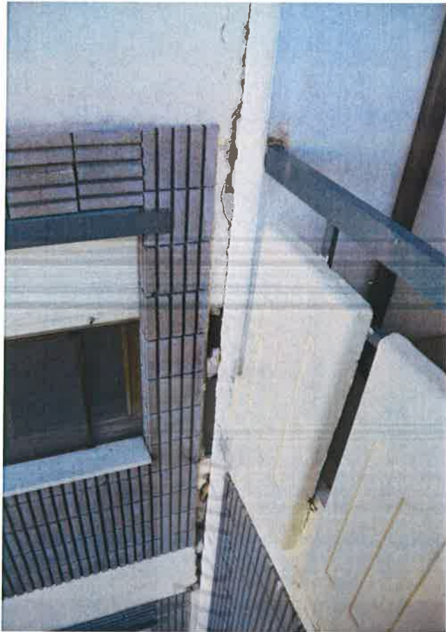
Foto n° 11: vista esterna - particolare lesione giunto tecnico lato est.